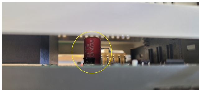
Kostal Artikelnummer 610206